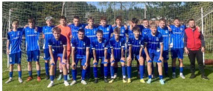
Futbalové mužstvo dorastencov

Týmto by som chcel vyzdvihnúť niektorých hráčov, ktorí počas celej sezóny pravidelne trénovali a podávali výkony, ktoré boli v niektorých