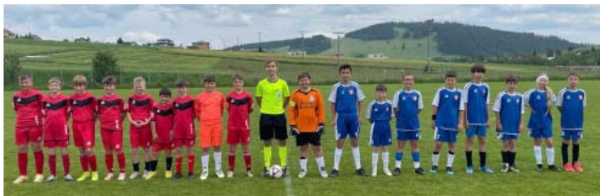
Mladší žiaci U13

Žiaci družstiev TJ Roháče Zuberca U15, U13, ktoré hrajú 2 ligu sú zložené prevažne z chlapcov našej dediny a blízkeho okolia. Tréningový proces do novej sezóny