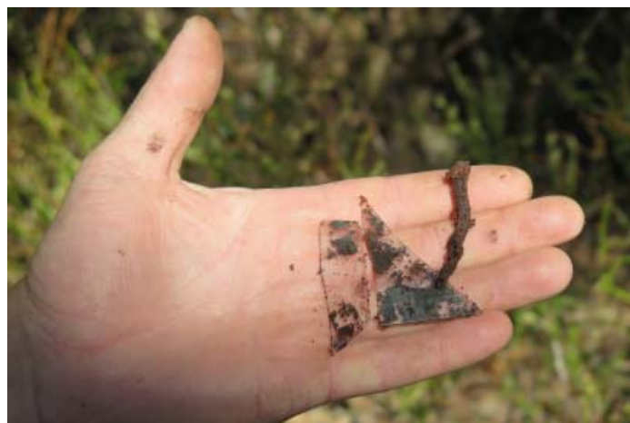
Vykopané sklo a klinec

bol prístup z Liptova a zo smeru od Oravic tu viedli len krivoľaké cesty roľníkov a ľudí pracujúcich v lese. Návštevníci prichádzali z Podbiela do Roháčov peši, alebo na konštruktívnych povozoch. Ich kroky na hrebeň Roháčov častokrát viedli práve cez Javorinu. Turistické výpravy boli viacdenné. K prenocovaniu slúžili mnohé známe i menej známe útulne. Jedna takáto sa nachádzala i na Javorine. Dlhé roky sme o útulni netušili. Na facebooku sa však objavila náhodná fotografia. Spoznali sme kopec Javorinú v pozadí s vrcholom Osobitá a na nej na naše veľké prekvapenie útulňa. Práve facebook sa dnes stáva zdrojom mnohých hodnotných fotografií, dokumentov. Vnuk, či pravnuk žijúci