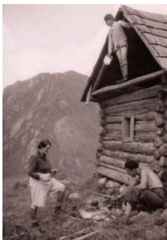
Historická fotografia útulne

nadmorskú výšku majú veľmi zaujímavé dimenzie. Javorina v sebe skrýva aj menej známe zaujímavosti. Popod jej vrchol vo svahu skláňajúcej sa na Zverovku je v teréne ešte stále poznateľná, ľudskou rukou vytvorená 3 m široká niekoľko desiatok metrov dlhá cestička. Zrejme slúžila k zväžaniu horniny ťaženej za účelom tavenia rudy. V Roháčoch a rovnako na Javorine bolo vydaných množstvo kutacích práv. Domnievame sa tiež, že spomínanú cestičku využívali tiež pastieri k vyhánaniu statku z dedín Studenej doliny na hrebeň Kasní, Lúčnu.