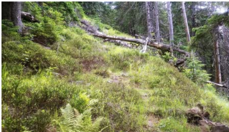
Cestička popod Javorinu

iných kopcov v Roháčoch. Avšak so svojimi 1581 m.n.m je to v rámci Slovenska jedno z najvyšších miest porastených súvislým smrekovým lesom, kde stromy na spomínanú