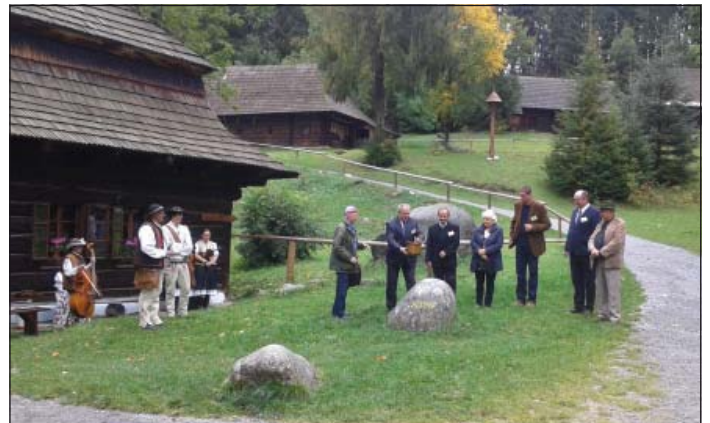
Pred päťdesiatimi rokmi presne takto polievali základný kameň Múzea oravskej dediny