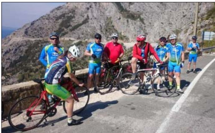
Prvé jarné kilometre sme absolvovali už 1. apríla na cyklokempe v chorvátskej Baške Vode