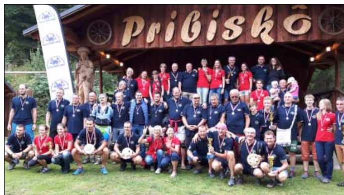
Tohtoroční účastníci Zuberského triatlonu zdravia