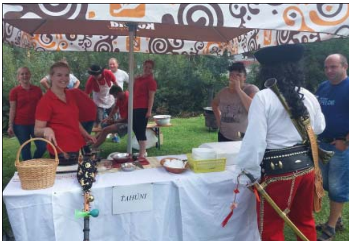
Aj náš Jánošík prišiel ochutnať