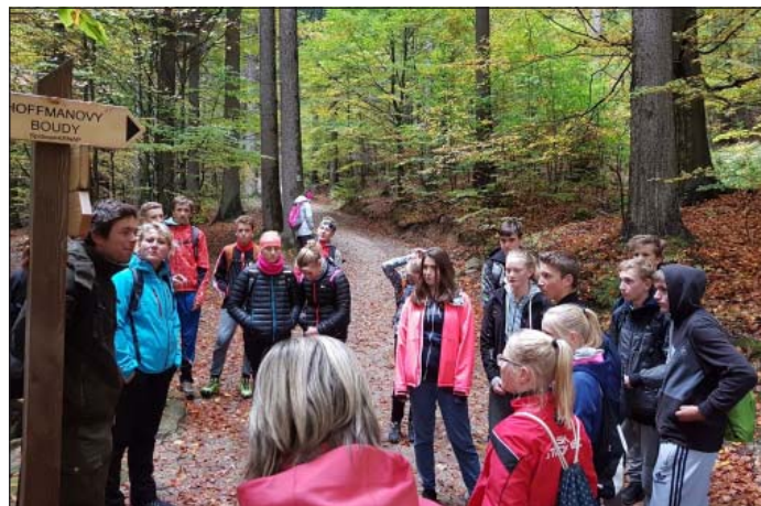
Spoločné aktivity detí v Krkonošiach

Domovom sa deťom a pedagógom na tento čas stal neďaleký Holiday Park Liščia farma. Tu sme tvorili jednu veľkú priateľskú komunitu.