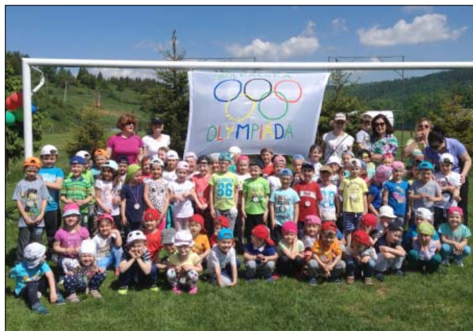
Deti si vyskúšali súťaže ako na ozajstnej olympiáde

silu, odvahu, šikovnosť, rýchlosť a obratnosť. Po výborných výkonoch boli všetci odmenení medailou, a posilnili sa špekačkami. Naspäť do škôlky sa odviezli Roháčskym turistickým vláčikom.