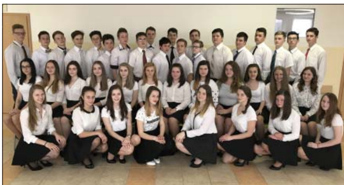
Absolventi tanečného kurzu