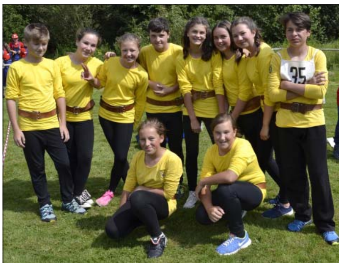
Družstvo zuberských hasičov, ktorí vybojovali 5. miesto v celkovom hodnotení na tohtoročnej súťaži Plameň.