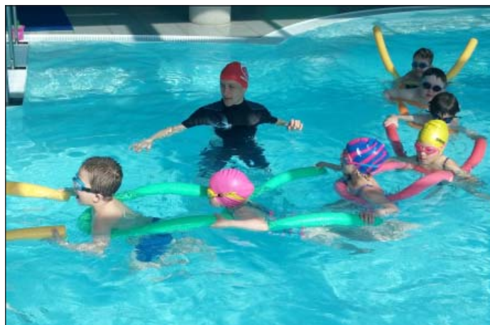
Ako ryby vo vode

Tulipánik. Cieľom kurzu bolo priblížiť deťom vodné prostredie a prostredníctvom rôznych pomôcok, hier prekonať strach z vody, zvládnuť základné plavecké zručnosti – dýchanie, ponáranie, love-