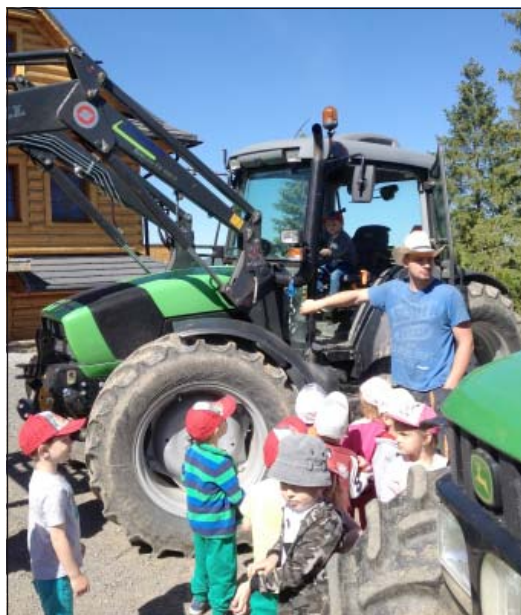
Chlapci si vyskúšali veľký traktor