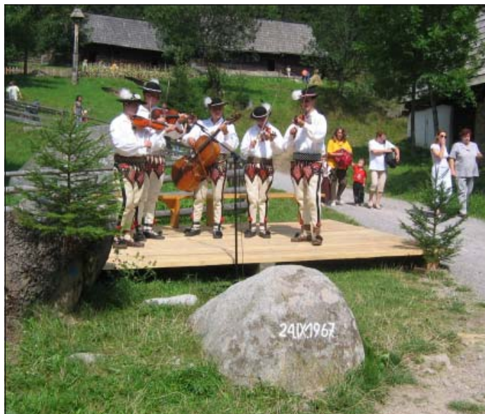
Základný kameň Múzea oravskej dediny

Výstava, si kladie za cieľ stručne predstaviť rozmanitosť činností múzea v prírode, ktoré patrí k najobľúbenejším múzeám svojho druhu na Slovensku. Predovšetkým je zameraná na predstavenie programov pre návštevníkov ale v skratke sa dotýka aj budovania i rekonštrukcií objektov. Okrem stálej expozície slúži historické a prírodné prostredie areálu pre široké spektrum využitia, vhodné pre filmové spoločnosti a iné záujmové